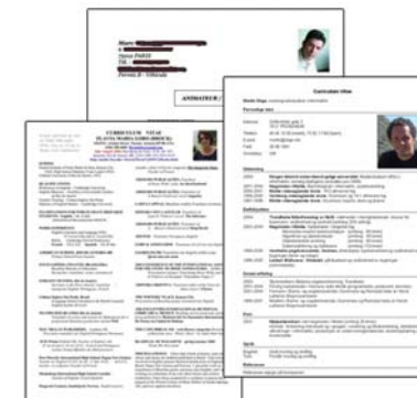
Une gestion efficace des candidatures